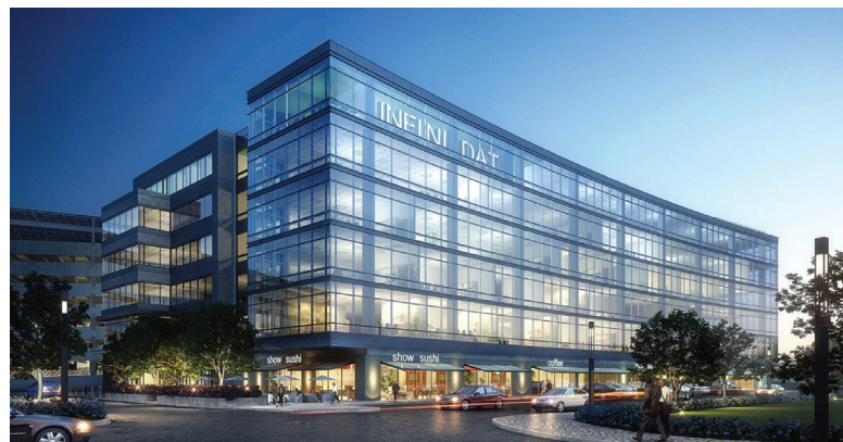
Das Executive Briefing Center in Waltham, MA – U.S. Hauptniederlassung