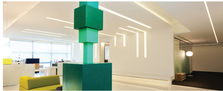
Herzliya, Israel – Oficinas centrales de Infinidat

Inversores y clientes han aplaudido claramente el enfoque de Infinidat hacia la innovación. Infinidat ha establecido un negocio rentable y en crecimiento, con 17 trimestres consecutivos de crecimiento e inversiones de TPG Growth y Goldman Sachs por un total de 325 millones de USD, lo que establece el valor de Infinidat en 1600 millones de USD. La base instalada de clientes a nivel mundial, que abarca un amplio número de sectores verticales como la salud, los servicios financieros y los proveedores de servicios en la nube, supera los 7,1 exabytes de capacidad de almacenamiento en Q4 de 2020. En la actualidad Infinidat cuenta con más de 140 patentes, un sólido crecimiento de sus ingresos y un equipo cada día mayor de profesionales técnicos dedicados al éxito de nuestros clientes en sus esfuerzos por innovar y crecer.