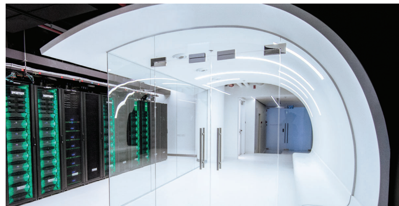
Il laboratorio QA a Herzliya, in Israele