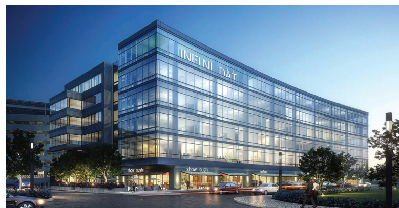
Executive Briefing Center di Waltham, MA - USA Quartier generale