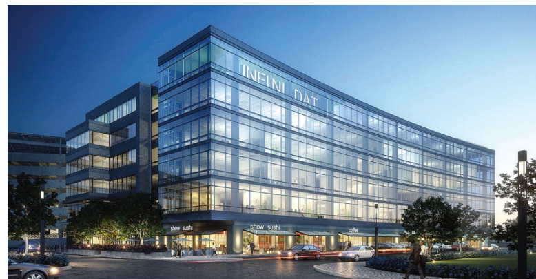
Брифинг-центр для клиентов в Уолтеме, шт. Массачусетс — штаб-квартира в США